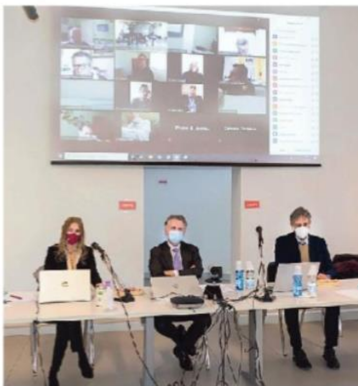
L'assemblea di giovedì del consiglio di amministrazione di Asm