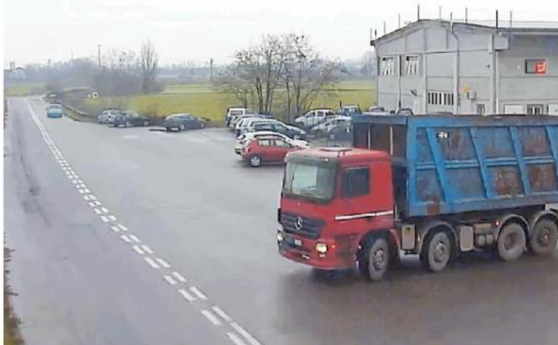
Una delle foto scattata dalla Guardia di finanza nelle indagini su assenteismo e traffico di rottami