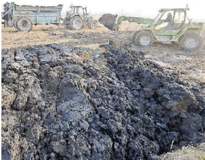
Fanghi utilizzati in agricoltura per concimare i campi