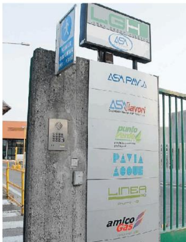
Asm Pavia e gli altri quattro soci di Lgh dovrebbero confluire in A2A

«Il percorso parte da lontano – spiega un comunicato del Comune – e precisamente da un accordo di partnership sottoscritto il 4 agosto 2016 dalla precedente amministrazione e dal Piano di razionalizzazione delle partecipazioni societarie deliberato dal Consiglio comunale il 30