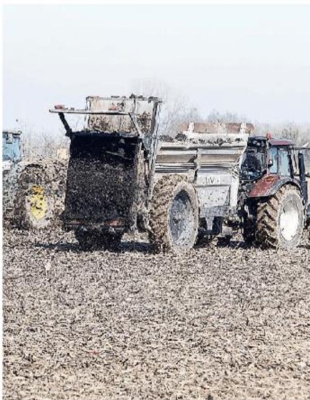
Il comitato "Io amo Giussago" chiede controlli e limiti ai fanghi

Una lettera in cui il Comitato sottolinea le preoccupa-