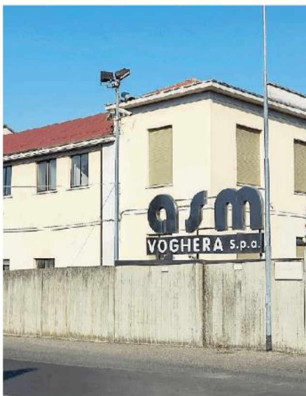
La sede di Asm Voghera, nominati i revisori dei conti