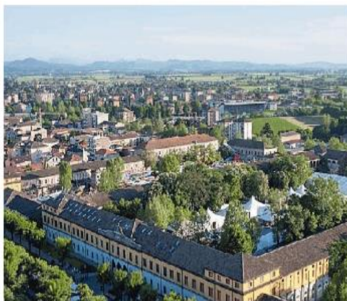
Una veduta panoramica della città di Voghera: è confronto sul Pgt