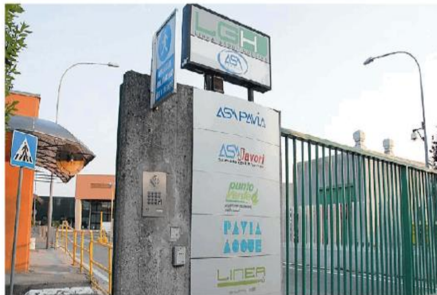
Nel perimetro di Asm Pavia Spa in via Donegani sta per liberarsi una superficie di circa quattro ettari