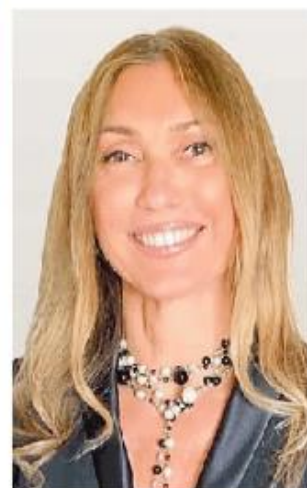
La sindaca Paola Garlaschelli

ranti presso le diverse società. Questo al fine di assicurare un'adeguata tutela degli interessi di tutti i cosiddetti stakeholders, soci, cittadini, lavoratori, clienti e fornitori». La maggioranza dei nominati, ricorda la sindaca, è iscritta all'ordine dei Dottori commercialisti di Pavia che sottolinea «sappiamo avere assorbito