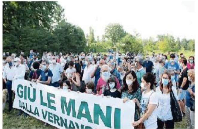
La manifestazione contro la caserma di giovedì scorso in via Cerise