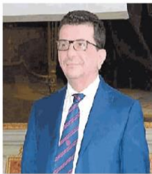
Il rettore Francesco Svelto

Regione Lombardia, le Università di Pavia, Milano, Milano-Bicocca, Politecnico di Milano, Cnr-Stiima hanno sottoscritto un accordo di collaborazione per promuovere la transizione verso un modello di economia circolare, basato sul riciclo di materiali e prodotti, estendendo il più possibile il loro ciclo di vita e