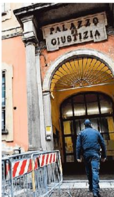
Il tribunale di Pavia

Per quattro anni si sono visti recapitare bollette da capogiro per il consumo di acqua e i costi di depurazione. Una stangata complessiva da 234.800 euro, notificata all'azienda da Pavia Acque e che i titolari della conceria Gi Since 1962 di Castello D'Agogna si sono rifiutati di pagare, convinti che ci fosse un errore nei calcoli. E così