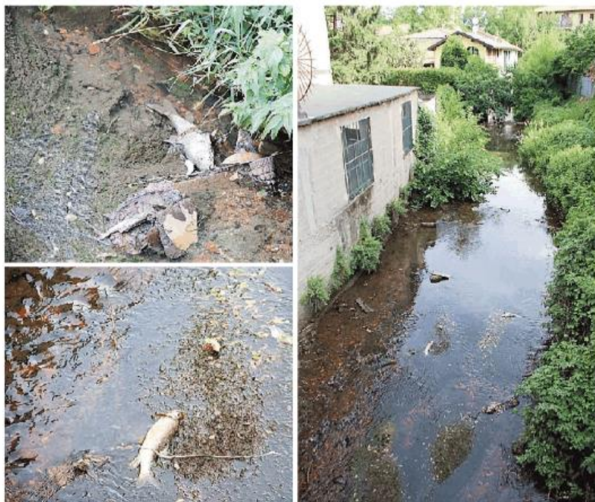
I pesci morti nell'acqua che ha assunto un colore rossastro a causa dello sversamento