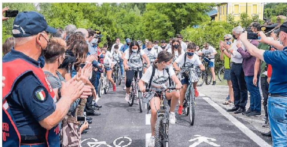
Tanti ragazzi hanno partecipato alla inaugurazione della greenway Voghera-Varzi