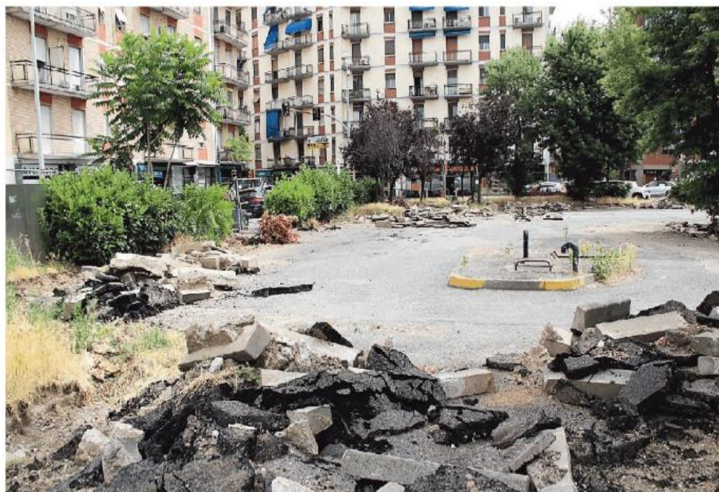
Il cantiere di piazzale San Giuseppe: al centro della foto si può notare il pozzo di Pavia Acque e sul perimetro i marciapiedi già demoliti