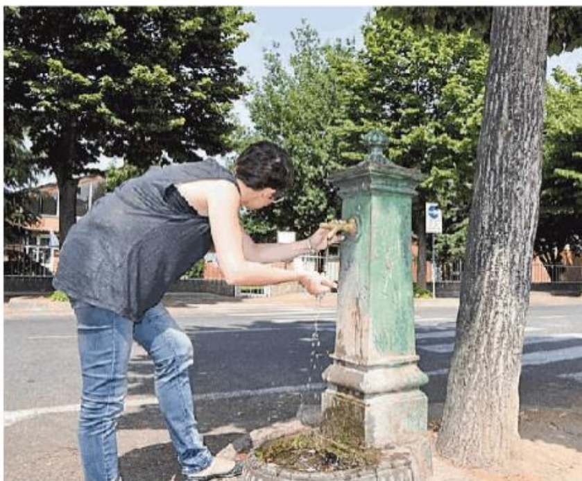
A Pavia ci sono 59 fontanelle: l'acqua è la stessa dei rubinetti

cinque stelle (acqua migliore) vede Pavia con altre 13 città in seconda fascia (quattro stelle) nella categoria "acqua buona" al pari ad esempio di Bolzano e Torino; superiamo anche Milano raggruppata in terza fascia (acqua discreta). In città il gestore dell'acquedotto è la società Pavia Acque che periodicamente effettua controlli nei