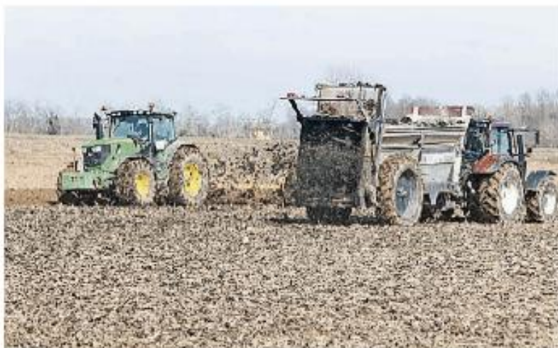
Gli spandimenti di fanghi nei campi al centro del dibattito ambientale