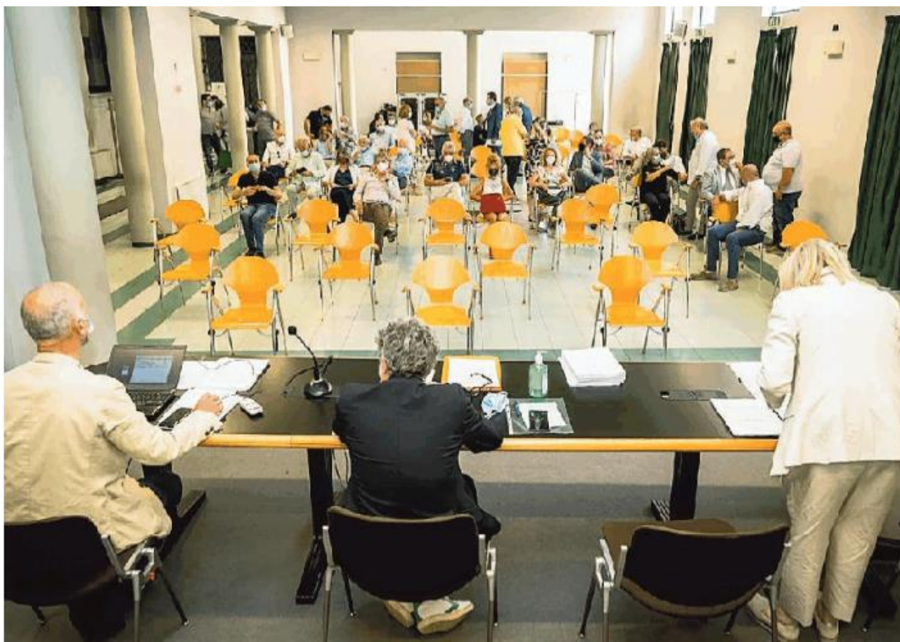
La trentina di sindaci oltrepadani che hanno partecipato in presenza all'assemblea di ieri