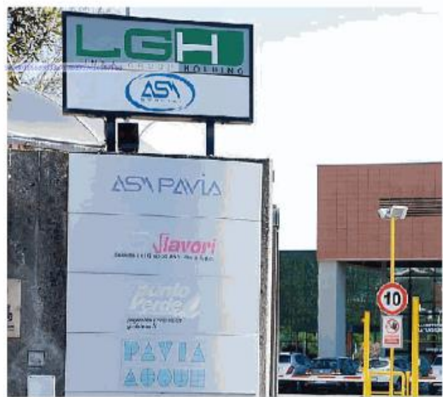
La sede di Asm Pavia: l'exmunicipalizzata ha il 7,79% di quote Lgh

Avanza dunque il processo di integrazione tra le due società avviato nel 2016 che porterà i cinque soci di minoranza di Lgh (oltre ad Asm sono Aem Cremona e Cogeme di Rovato con il 15,15% ciascuna, Astem Lodi con il 6,48% e Società cremasca servizi con il 4,43%) a detenere il 2,75% di A2A, che già possedeva il 51% di Linea