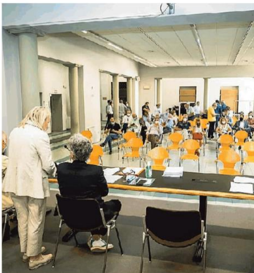
L'ultima assemblea della Broni-Stradella Pubblica