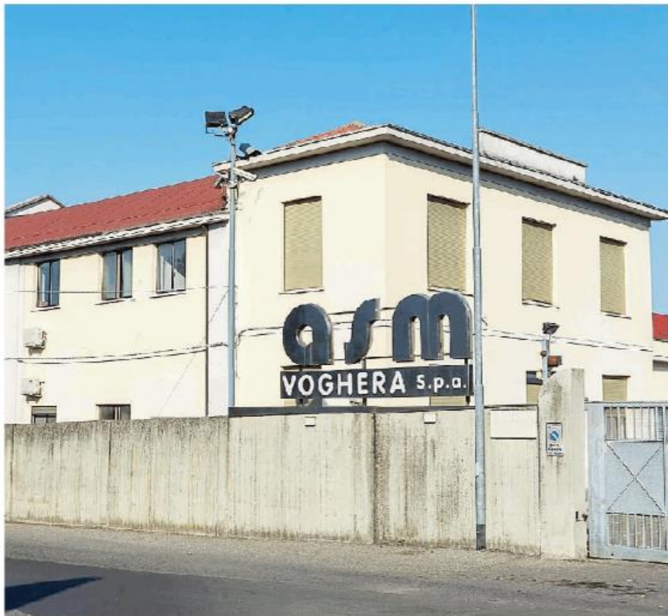
La sede di Asm Voghera SpA, in via Pozzoni. L'azienda ha avuto un 2020 difficile per i conti

Molte le ragioni della difficoltà di bilancio di Asm, ragioni che sono sottoposte a verifica, tramite una due diligence affidata alla società di revisione Price Waterhouse. In primo luogo, la crisi Covid: dalla relazione ai soci emergono ricavi in calo nei settori del teleriscaldamento, della ristorazione e della sosta a pagamento. Il secondo elemento, anch'esso oggetto di indagine interna, è la transazione con la società Alan tramite la quale Asm si è ripresa il biodigestore (contratto firmato il 24 giugno 2020 «dai precedenti amministratori su delibera dell'amministratore delegato», si precisa nella relazione). Qui il costo della pe-