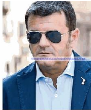
Gian Marco Centinaio

L e polemiche sul bando per il nuovo direttore generale di Asm si trasformano in uno scontro interno al centrodestra. Il sottosegretario della Lega Gian Marco Centinaio risponde a quanto scritto dal deputato di Forza Italia Alessandro Cattaneo sui social (post poi rimosso) in merito ai requisiti richiesti per ricoprire il ruolo in via Donegani. Parliamo di un bando, in via di riformulazione, che in base alla prima stesura lo stesso Cattaneo aveva definito come limitativo: «Il ruolo può essere assegnato ad un laureato in economia con la triennale, ma non ad un ingegnere. La delegazione di Forza Italia ha chiesto comunque che non ci sia una spartizione politica di poltrone in Asm, così eravamo d'accordo con la Lega. Ora è il momento di applicare gli accordi», aveva scritto. Passate poche ore è arrivata la replica a muso duro di Gian Marco Centinaio che fa intuire questioni politiche dietro alla presa di posizione sui titoli di studio: «Esprimo il mio totale disaccordo e prendo le distanze dalle dichiarazioni dell'onorevole Cattaneo. Se l'obiettivo fosse quello di estendere la platea dei potenziali partecipanti lo riterrei pienamente condivisibile; al contrario, se la sua azione fosse telecomandata da Voghera per