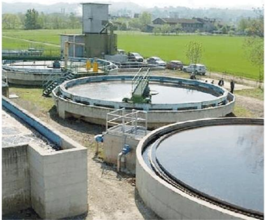
Il depuratore di Casteggio al centro della vicenda giudiziaria