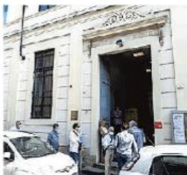
Alcuni sindaci presenti

La Broni-Stradella Pubblica ancora senza il nuovo consiglio di amministrazione. La riunione dei Comuni soci, che era in programma ieri pomeriggio, infatti, si è risolta con una seconda fumata nera, anzi, in questo caso non c'è nemmeno stata l'assemblea, che è stata rinviata a lunedì 19 lu-