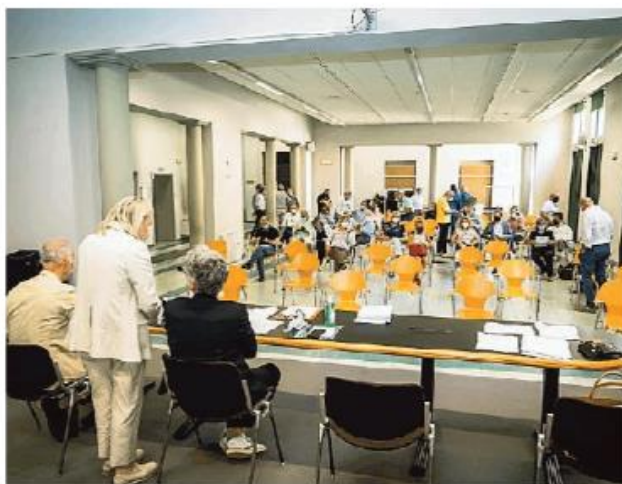
L'assemblea dei soci del 28 giugno a Stradella