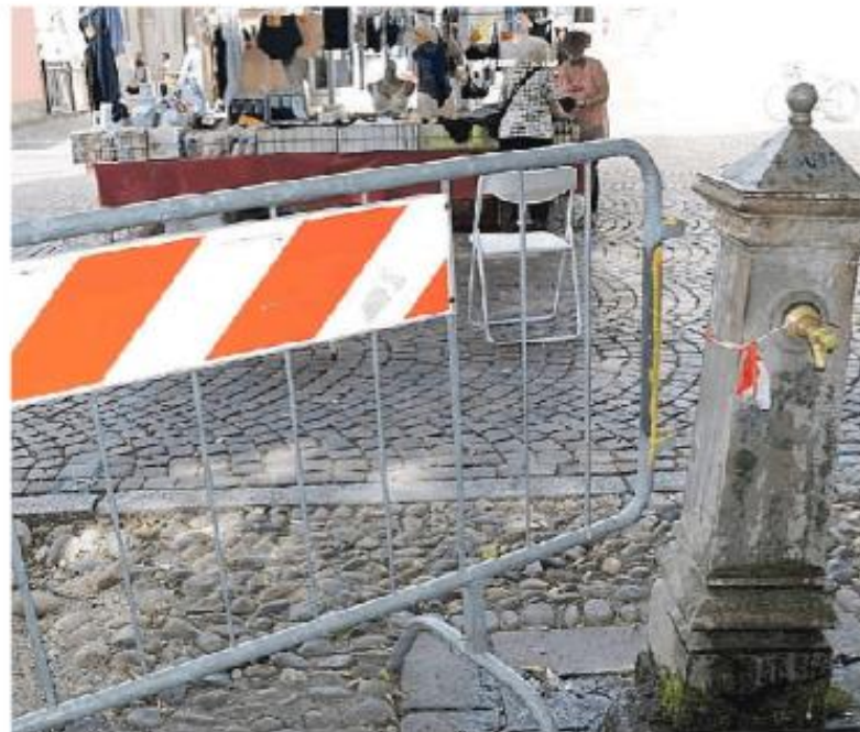
La fontanella di piazza Petrarca, invece, è rotta ormai da tempo

che l'acqua è un bene limitato. Fortunatamente, l'amministrazione comunale ha presente la situazione e sta già correndo ai ripari.