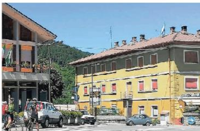
Al Brallo il disagio per il guasto alla rete idrica provocato da una frana

«Nella giornata di venerdì una frana ha investito le tubazioni dell'acquedotto - spiega il sindaco del Brallo - e fino a quando i serbatoi sono rimasti pieni nessuno si è accorto del problema. Quando l'acqua ha iniziato a scarseggiare ed è stato con-