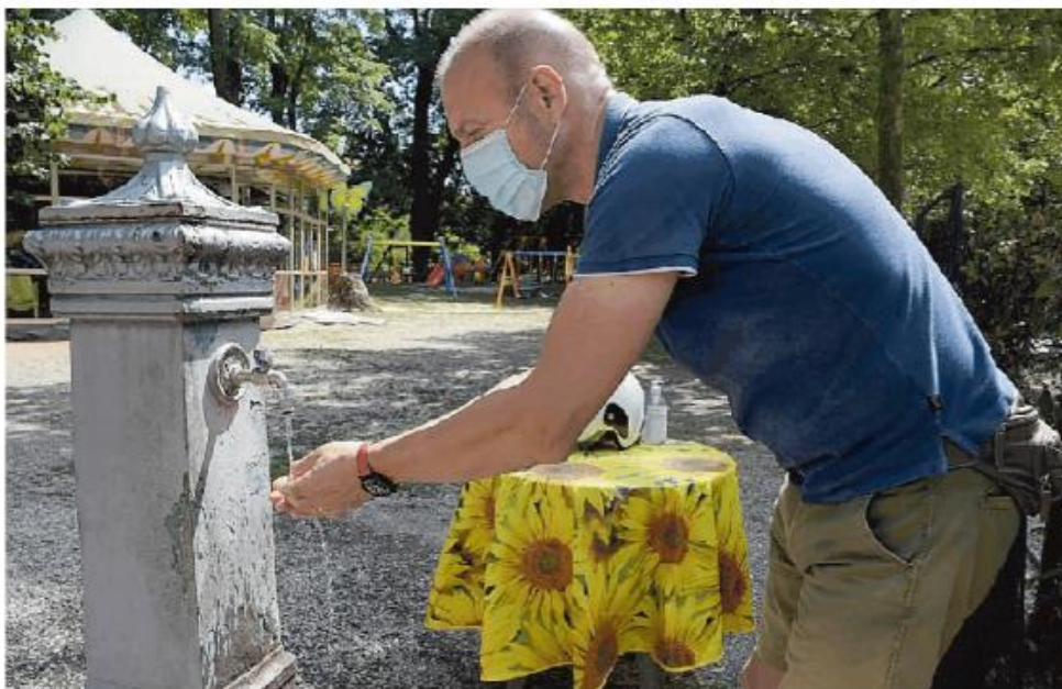
Nei giardini del castello Visconteo la fontanella funziona bene e offre ristoro ai cittadini più accaldati

Poi i vandali hanno fracassato le panchine e i vespasiani, come i panda, si sono progressivamente incamminati verso l'estinzione. Sono rimaste le fontanelle che, a Pavia, sono 55 e costituiscono ancora una sana, ecologica e conveniente alternativa all'acquisto della classica bottiglietta di acqua minerale da mezzo litro. Peccato che pa-