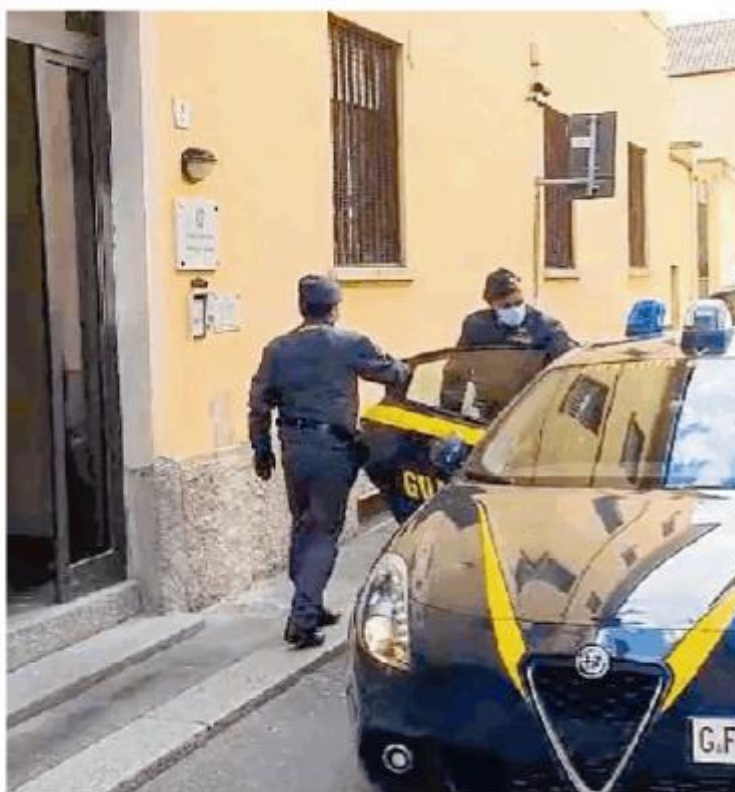
I militari della guardia di finanza di Voghera indagano sulla vicenda