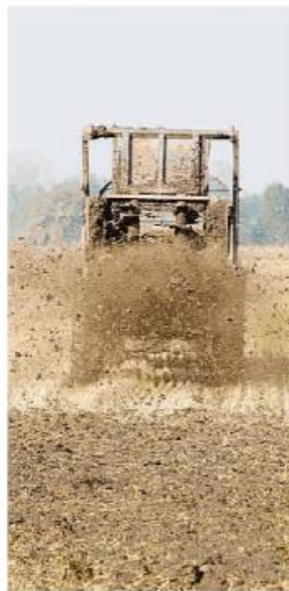
UN MEZZO AGRICOLO IMPEGNATO NELLO SPANDIMENTO DI CONCIMI NELLE CAMPAGNE LOMELLINE

«Ho inviato venerdì scorso - dice l'assessora - una missiva ad Ats, Provincia ed Istituto