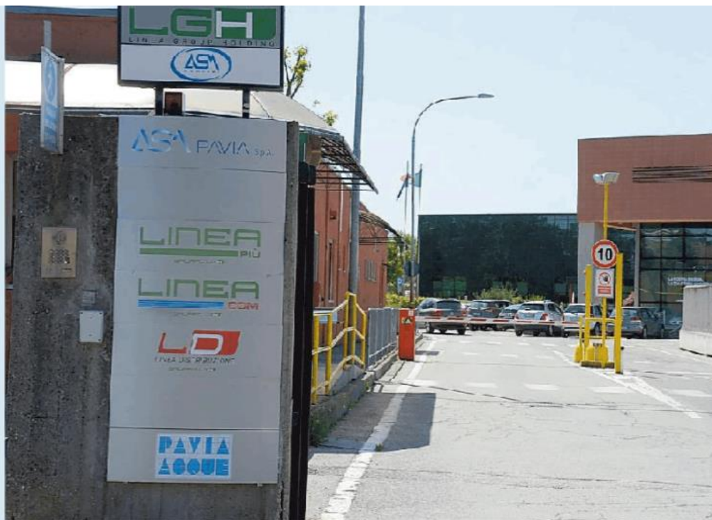
Asm Pavia Spa resterà nell'orbita di A2A secondo quanto ha deciso il suo socio principale, il Comune

Uno dei motivi per cui il Comune aveva deciso di vendere le quote di A2A era che la loro proprietà, sulla base di una sentenza del Consiglio di Stato, avrebbe impedito ad Asm di ricevere direttamente, senza gara pubblica, i contratti per la cura del verde, per i rifiuti e per la sosta. Nella delibera che arriverà all'attenzione del Consiglio, però, si dice che i due soci pubblici di A2A (i Comuni di Milano e di Brescia) garantiscono il controllo pubblico coordinato di A2A, anche tramite un apposito patto parasociale. Questo integrerebbe la prevalenza dell'interesse pubblico raccomandata dal Consiglio di Stato.