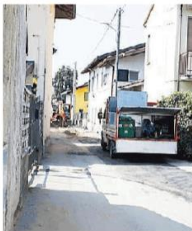
I lavori in via Roma ad Alagna

Pavia Acque investe per il completamento dell'opera quasi 150mila euro, soldi necessari per la sistemazione dei manufatti che costituiranno il nuovo collettore