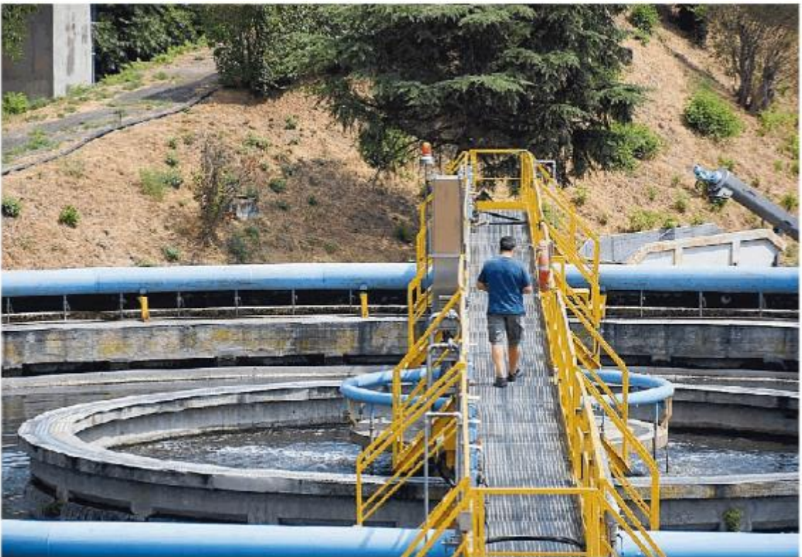
In alto, i lavori per la nuova sede in via Taramelli. Qui sopra il depuratore di Montefiascone