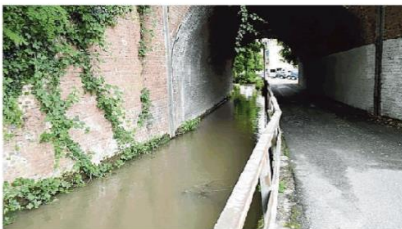
La parte di roggia che dovrebbe essere coperta per allargare la strada

I problemi di questa zona sono due: il primo è la manutenzione della roggia che la attraversa. Questo punto della città è una specie di conca naturale e, in occasione di un violento temporale, si è già allagata completamente, con ingenti danni alle cose e con una donna che è rimasta ferita dopo avere inciampato in una buca che era ricoperta dall'acqua. Il tema, in questo caso, è quello della manutenzione della roggia Vernavolino. Nessuno se ne prende cura perchè non si è ancora capi-