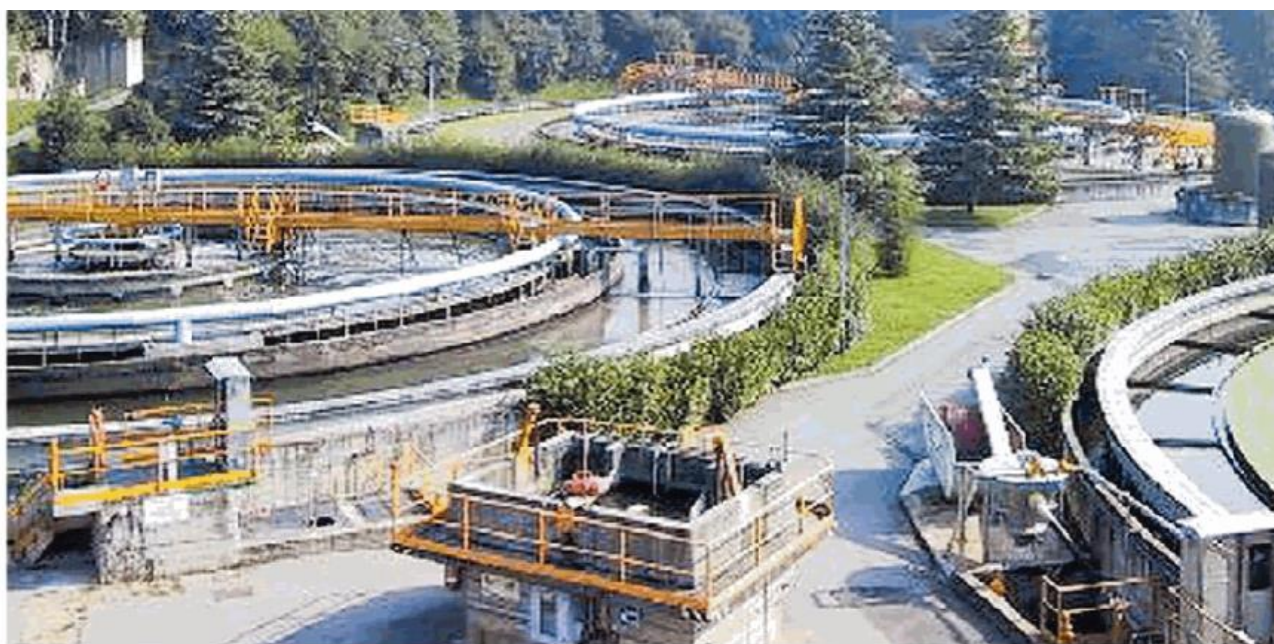
Il depuratore di Montefiascone a Pavia produce circa 6mila tonnellate di fanghi l'anno che devono essere trattati

anni, di San Genesio. Entrambi sono stati sospesi dagli incarichi relativi ad appalti.