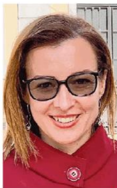
La sindaca Chiara Rocca

persona più adatta a raccogliere il mio testimone».