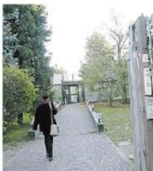
La sede della Cna di Pavia

La Cna (associazione artigiani e piccole imprese) di Pavia organizza corsi di formazione sulla sicurezza per tutti i settori produttivi e le professioni, per essere sempre aggiornati sulle novità, gli obblighi, le normative e le competenze necessarie. Si tratterà di cinque appuntamenti da ottobre a novem-