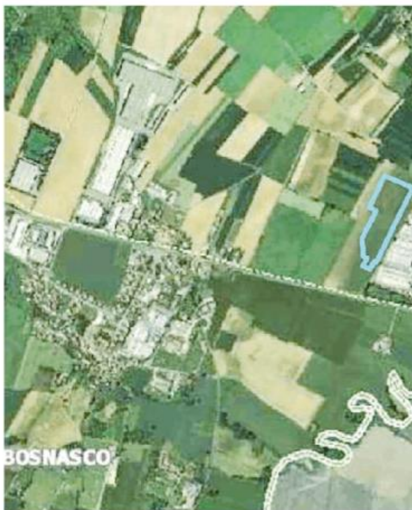
A destra tratteggiata in blu l'area dove dovrebbe sorgere l'impianto