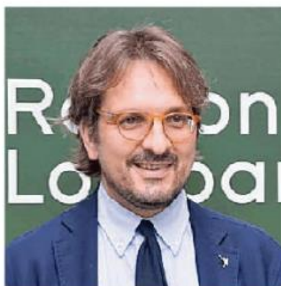
L'assessore Guido Guidesi

Una spinta necessaria per far ripartire l'economia lombarda, dopo lo stop dovuto al-