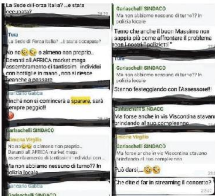
Gli screenshot della chat di giunta con la frase di Giancarlo Gabba