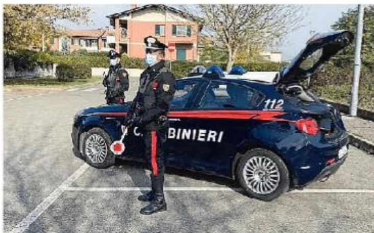
Un posto di blocco dei carabinieri nella zona di Stradella