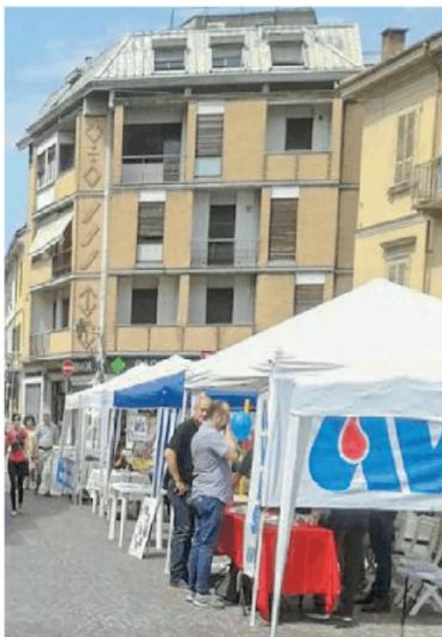
La festa del volontariato che si è svolta a Broni nel 2018