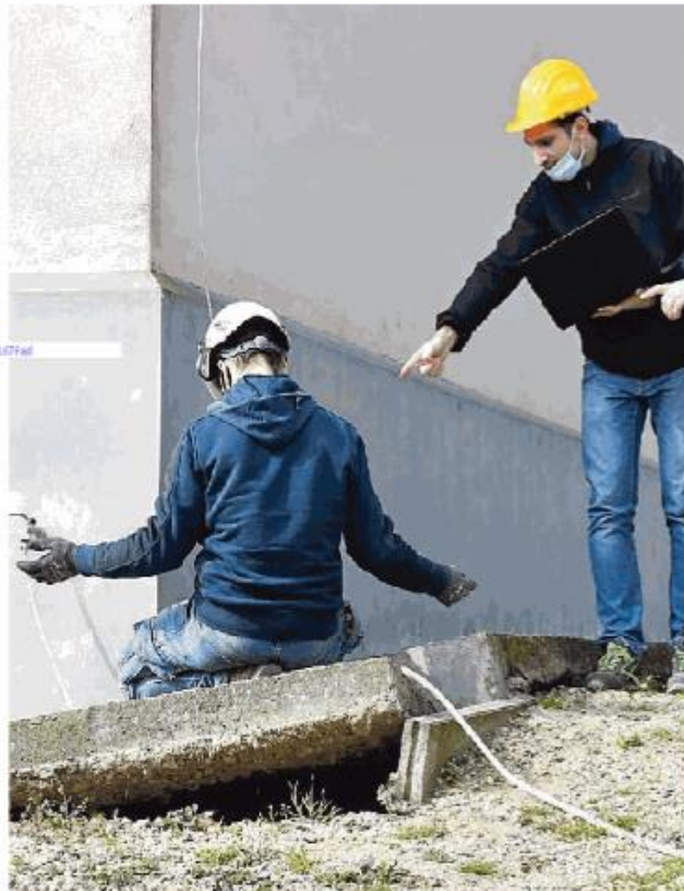
Le fondamenta sono sprofondate per circa 15 centimetri

Al momento non c'è nulla di ufficiale perché le indagini affidate dal tribunale ad un consulente tecnico termineranno entro la fine del mese (l'elaborato definitivo verrà poi depositato dal tribunale il prossimo 10 novembre), ma come logico una cosa esclude l'altra.