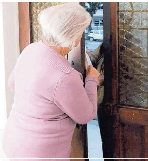
Ancora un'anziana vittima delle truffe dei falsi operai

La truffa riuscita è stata messa a segno, giovedì mattina, a Casei Gerola in via Carena nell'abitazione di una pensionata di 77anni. Due uomini si sono presentati all'ingresso dell'abitazione e si sono spacciati per operai addetti al controllo del