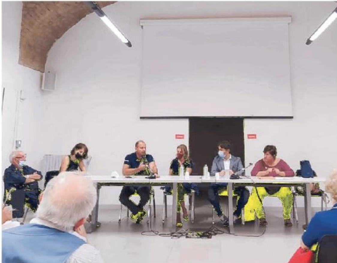
Un momento dell'incontro che si è svolto tra l'amministrazione comunale e la Consulta