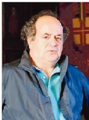
Il sindaco Antonio Costantino

Sono nate le guardie ecozoofile, vigileranno anche sullo spandimento dei fanghi sul territorio comunale. La settimana scorsa il sindaco di Gambolò Antonio Costantino è stato costretto a richiedere l'intervento di Ats a seguito delle segnalazioni di alcuni cittadini in merito alla presenza di odori fastidiosi. «Abbiamo chiesto – dice Costantino – l'intervento di Ats in seguito alle segnala-