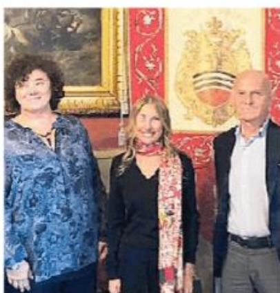
La sindaca e i due neoassessori