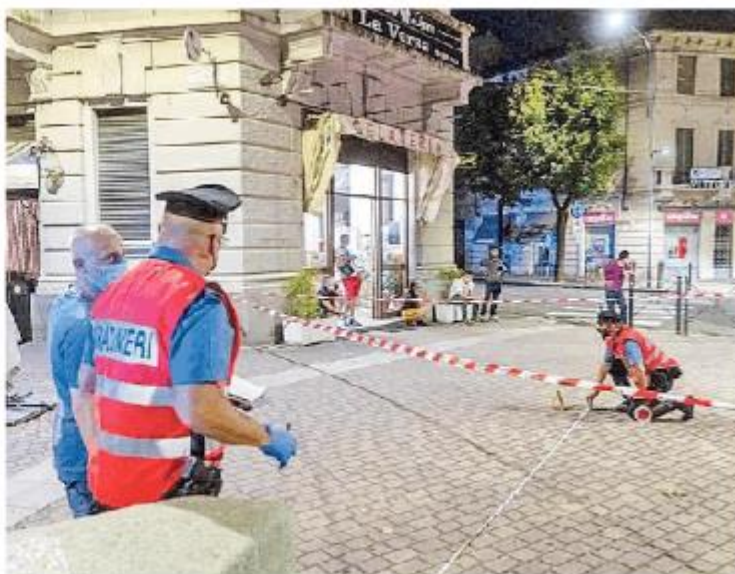
Irilevi dei carabinieri sul luogo dello sparo mortale in piazza Meardi

uno agli arresti domiciliari, il secondo da giorni senza deleghe, il terzo ancora in carica, hanno messo in pratica prima e giustificato dopo la “giustizia fai da te”, e l'utilizzo delle armi come metodo per risolvere il problema della sicurezza. L'esternazione dell'assessore Gabba “finché non si comincerà a sparare sarà sempre peggio”, è un'impostazione deviante rispetto alla legge e all'equilibrio che deve caratterizzare chi ha la responsabilità della gestione della collettività. Una dichiarazione che, in concomitanza con l'apertura del nuovo anno scolastico, risulta