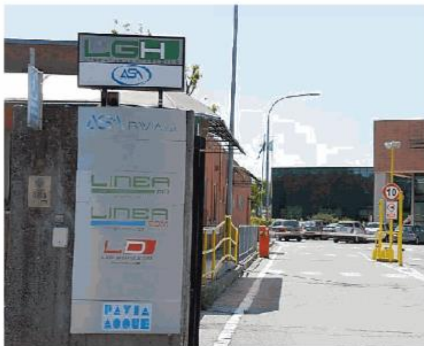
La sede operativa di Asm in via Donegani

una esterna, è riuscito a superare la quota minima totale di 60 punti su 100. Numeri che rispetto al precedente bando del 2020, quando poi venne nominato Davide