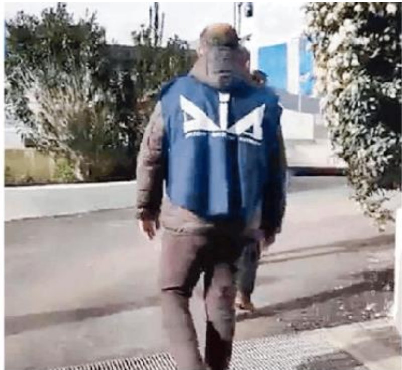
Agenti della Direzione investigativa antimafia in azione

Sul territorio della provincia di Pavia, dove le indagini hanno evidenziato la presenza di cellule criminali collegate alla "locale" di Laureana di Borrello, il radicamento della 'ndrangheta passerebbe soprattutto