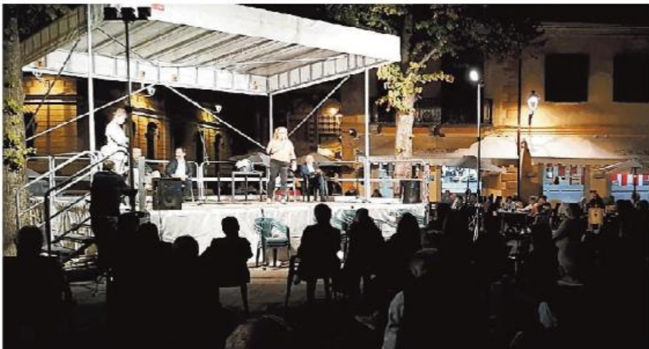
Il dibattito di venerdì sera in piazza della Repubblica, sul palco i due candidati sindaci e i giornalisti

porterebbe anche problemi per le voci del bilancio comunale. Per esempio, il Comune di Vigevano ha destinato tre dipendenti solo per la gestione del teatro Cagnoni: a