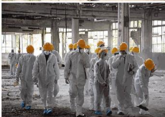
A sinistra le operazioni di prelievo di campioni da analizzare su suolo e acqua della ex Necchi (sopra) dopo i primi sopralluoghi (sotto)