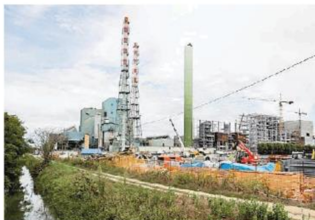
Il gestore ha chiesto di poter bruciare fanghi nell'inceneritore

ca, un permesso richiesto agli impianti inquinanti che si trovano vicini alle aree che fanno parte del circuito Rete Natura 2000. In questo caso si tratta della Garzaia della Portalupa. Rete Natura 2000 è una classificazione, voluta dalla Unione Europea, stabilita dopo che era stato dato il permesso di costruire il termovalorizzatore. Rete Natura 2000 richiede un'analisi ambientale approfondita laddove si debbano autorizzare impianti inquinanti vicino