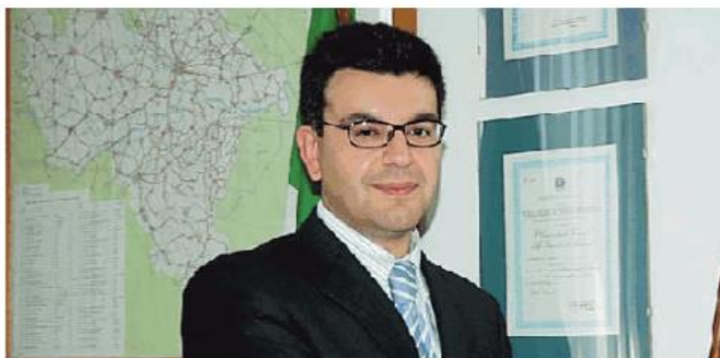
Gianmaria Testori, vicesindaco ed ex sindaco di Pietra de' Giorgi