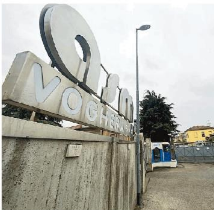
L'ingresso della sede di Asm Voghera, in via Donegani

Il problema era molto semplice. In Asm Voghera lavorano circa una settantina di dipendenti, di cui almeno diciassette sono interinali, cioè provvisori, a tempo determinato. Una percentuale