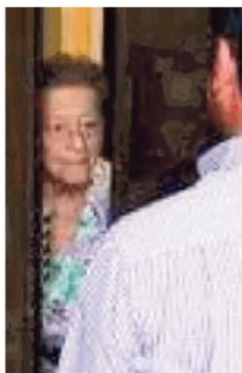
Ancora gli anziani nel mirino

Del caso si stanno occupando i militari dell'Arma della stazione di Broni, insieme con il nucleo operati-