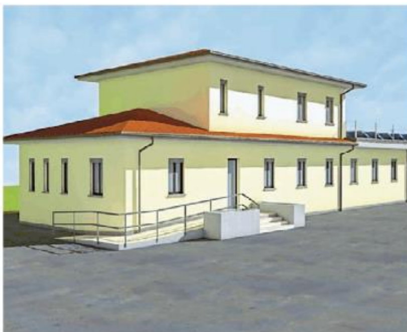
Il progetto (in rendering) della palazzina che ospiterà spogliatoi e uffici

dell'acqua calda sarà dotato di pompa di calore, rete di distribuzione e convettori a bassa temperatura per gli spogliatoi e servizi al piano terra e impianto di climatizzazione per gli uffici al primo piano.