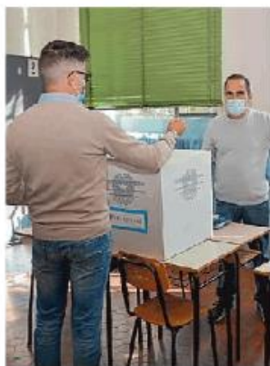
Urne aperte oggi e domani