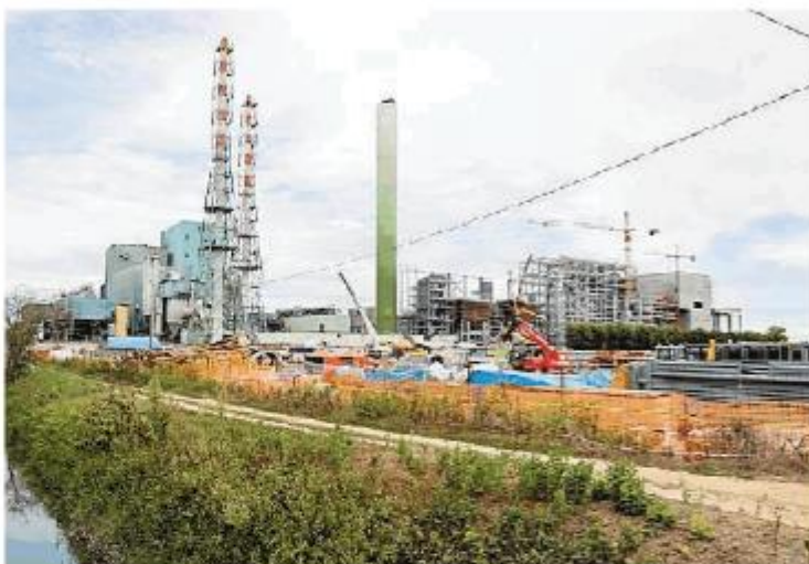
L'inceneritore di Lomellina Energia a Parona

Ma di colpi di scena non dovrebbero essercene, perché lo screening arrivato ieri in conferenza dei servizi dice in sostanza che il nuovo impianto è compatibile con la Garzaia Portalupa, che si trova a pochi