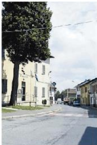
La via centrale del paese