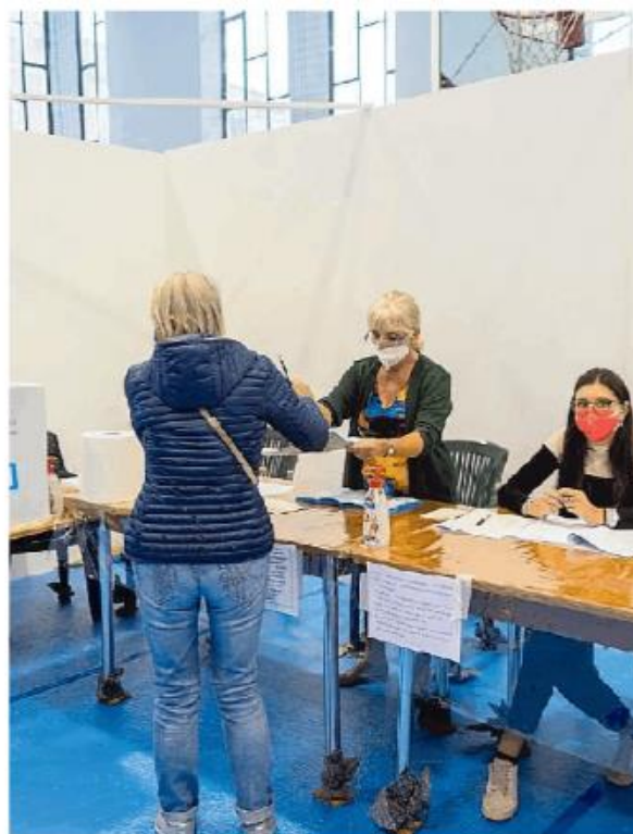
Operazioni di voto in un seggio elettorale di Broni

A Broni, secondo comune per popolazione, 42,77% (51,69%). Mede 33,97% (47,95%). Sannazzaro 39,06% (51,15%). Gropello 39,15% (50,12%). San Gensio 43,84% (53,37%). Cortolona 47,39% (56,18%). Badia 45,76% (60,94%). Borgo San Siro 39,39% (62,57%). Brallo 43,07% (59,14%). Brema 30,88% (38,96%). Ceretto 47,67% (58,54%). Confienza 35,65% (52,85%). Costa de' Nobili 39,59% (51,37%). Cozzo 32,91% (40,66%). Lardirago 50,32% (65,01%). Mezzana Bigli 41,28% (51,46%). Montù Beccaria 43,48% (46,62%). Portalbera 43,63% (50,81%). Rognano 38,72% (32,46%). Rovescala 47,81% (56,34%). San Ciriaco 42,74 (60,2%). Sant'Angelo Lomellina 31,32% (59,08%). Suardi 40,93 (62,91%). Torricella Verzate 48,36% (57,35%).