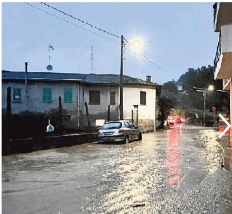
La strada per Recoaro allagata dopo il violento temporale di ieri