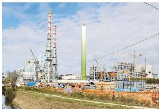
L'inceneritore brucia fino a 380mila tonnellate di rifiuti all'anno

L'idea di bruciare i fanghi è venuta al Cda di Lomellina Energia, partecipata della multiutility del Comune di Milano A2a, perché negli ultimi anni i rifiuti da bruciare nel termovalorizzatore sono diminuiti, causando una perdita economica all'impianto. L'essiccazione dei fanghi rappresenta una pratica alternativa e meno inquinante rispetto alla dispersione in agricoltura, ma le associazio-