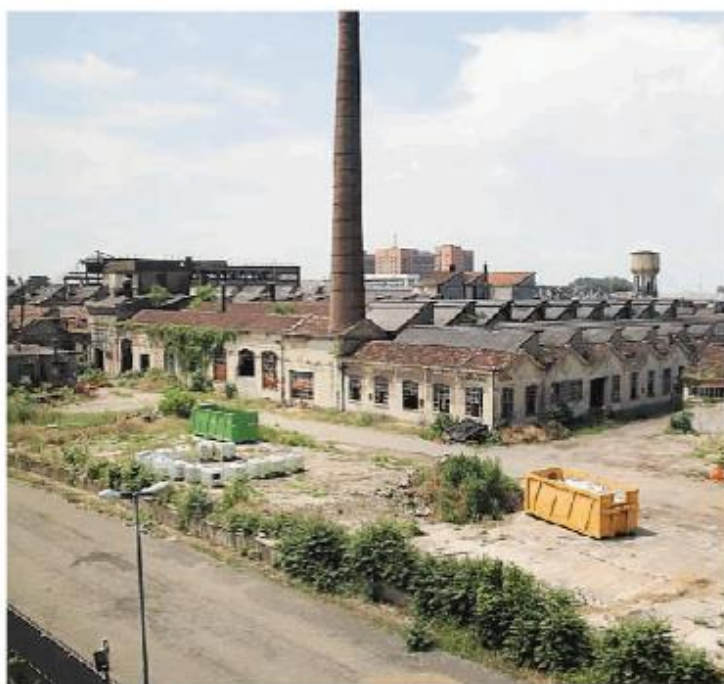
L'area della ex Necchi è al centro di una procedura di rigenerazione

La richiesta del Coisp discende dal fatto che, sulla falda, si trovano la questura e la sede della polizia stradale, oltre a un asilo ed esercizi commerciali. Sull'area venne effettuata una campagna triennale di controllo da parte della Provincia che, nel 2016, rilevò il superamento di alcune soglie di inquinanti, soprattutto il tetracloroetilene. La stessa situazione è stata confermata dalle analisi, in contraddittorio, dell'attuale proprietà dell'area, la società Pv01Re e dell'Arpa Lombardia. Nel maggio 2017 l'amministrazione provinciale, dopo una lunga e complessa indagine ambientale che aveva fatto emergere il potenziale inquinamento delle acque sotterranee sotto un'area di 9 chilometri quadrati comprendente anche le aree dismesse ex Neca, Marelli e scalo merci, emise