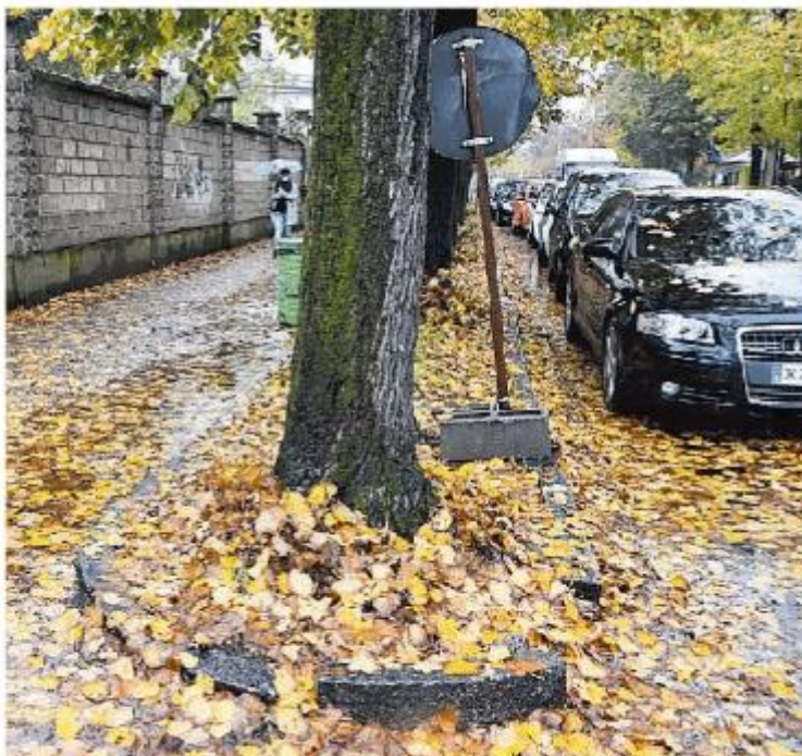
La sosta abusiva in via Taramelli potrebbe essere all'ultimo atto