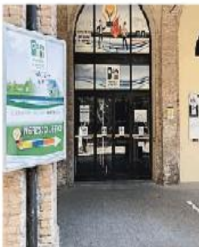
La sede di Asm VeS