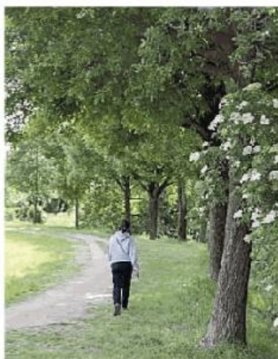
Il parco della Vernavola

Rilanciare il Crea, il centro di valorizzazione dell'educazione ambientale di via Folperti. Un obiettivo che si è prefissato la giunta comunale di Pavia annunciando ieri una delibera di indirizzo per la ripresa della struttura. Nel concreto, quindi, le azioni da intraprendere verranno definite in un secondo momento in base all'input arrivato dalla giunta Fracassi. «Auspichiamo che con le