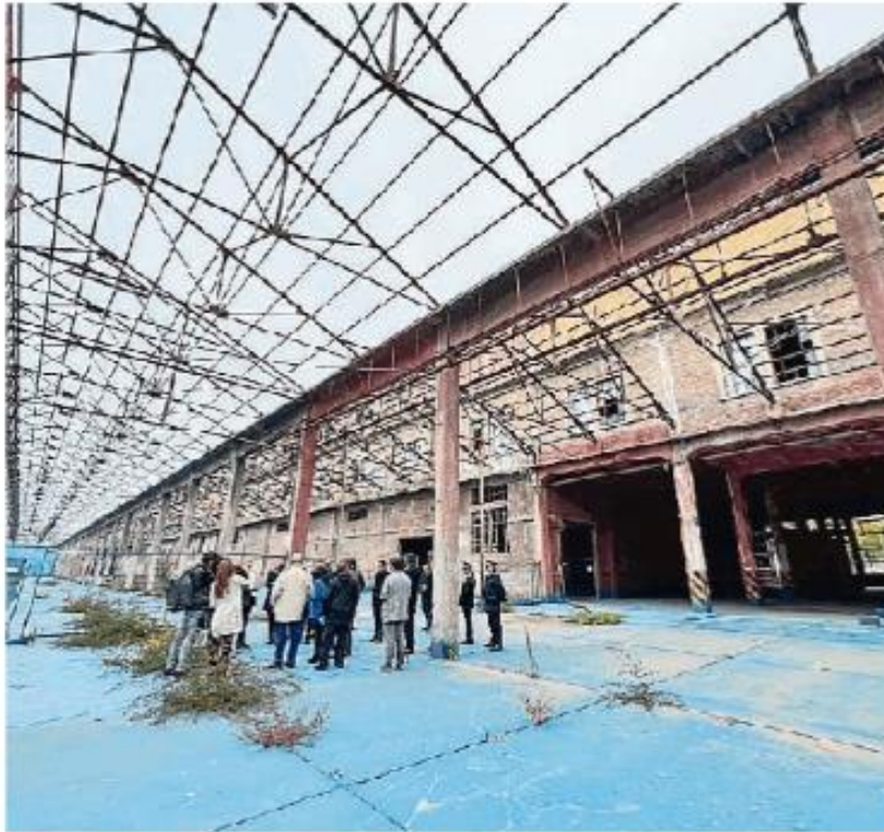
La visita all'area dell'ex Fibronit prima del convegno

ne dal ministero dell'Ambiente, consisterà nella demolizione delle strutture, nella bonifica della palazzina degli uffici posta all'interno dell'area, nella messa in sicurezza permanente della pavimentazione e dei terreni, nella rimozione delle fognature interraste rimanenti e nello smaltimento al di fuori del sito dei rifiuti risultanti dalle operazioni di bonifica.