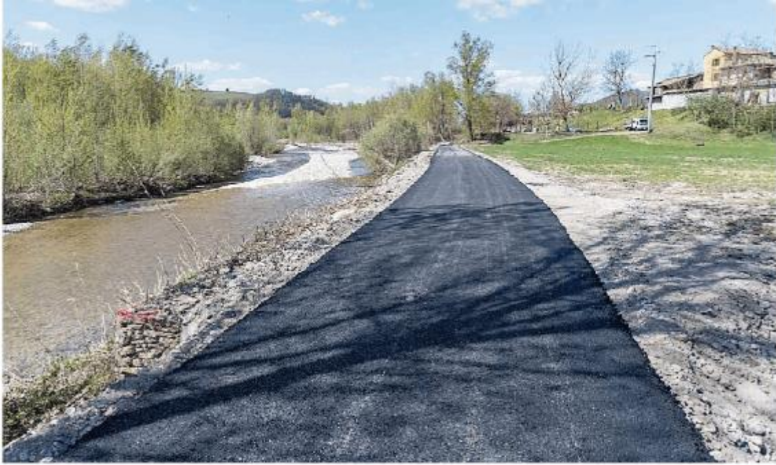
La greenway verso il definitivo completamento: la ciclabile attraverserà il centro di Varzi