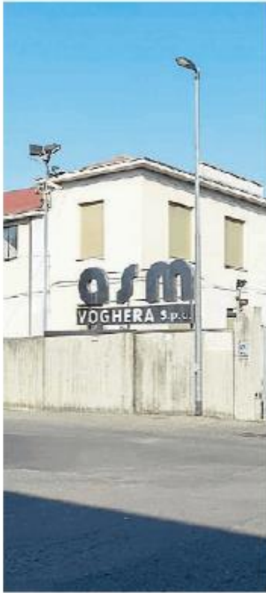
La sede dell'Asm Voghera

L'attuale Cda di Ves avrebbe deciso di rinunciare alla causa. Il Cda dovrà comunque motivare la decisione di "lasciar perdere" un tesoretto pari a 11 milioni di euro. Durante l'assemblea è stato illustrato il perché della trasmissione della due diligence alla Corte dei Conti. «È stato evidenziato come siano ravvisabili profili di violazione dei principi e dei doveri di corretta amministrazione, di diligenza e di fedeltà, in particolare, a titolo commissivo, in capo alle funzioni apicali del management di Asm Voghera – si legge nella nota legale – tali da condurre a configurare situazioni di responsabilità patrimoniale, sul piano vuoi civilistico, vuoi, in relazione alla natura di società in house di Asm Voghera, amministrativo-contabile per danno erariale causato ad Asm