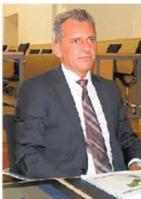
Il presidente di Asm Elleboro