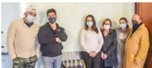
I condomini chiedono a Pavia Acque la posa dei singoli contatori

VIGEVANO - È ripresa la fornitura di acqua al condominio di via Valletta Fogliano 52/6 al quale era stata sospesa per una morosità di 21 mila euro maturata nel corso di alcuni anni. «Siamo stati tre settimane senza acqua - spiegano i residenti, 16 famiglie in tutto con anziani, invalidi e bambini piccoli - in una situazione al limite dell'assurdo. Abbiamo dovuto arrangiarci e le difficoltà sono state enormi. Non ultima quella di raccogliere i 7 mila euro necessari per saldare la prima rata della dilazione che ci è stata concessa da Pavia Acque».