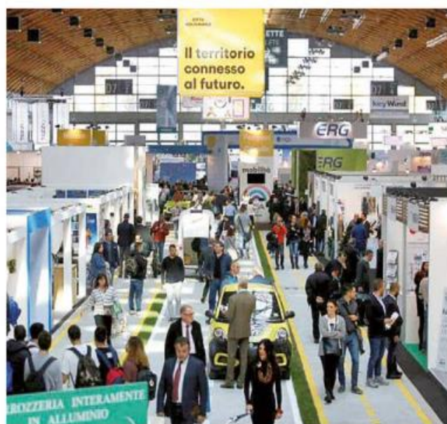
Il corridoio principale di Ecomondo, che si è svolto a Rimini

La strada per la transizione ecologica è tracciata e passa da Rimini, dove si sono chiusi il 29 ottobre con risultati ben oltre le più rosee previsioni Ecomondo e Key Energy, i due saloni dedicati all'economia circolare e alle energie rinnovabili di Italian Exhibition Group. Quasi l'85% di presenze rispetto all'ultima edizione pre-Covid, più di 1.080 marchi presenti a tutto quartiere per il 90% della superficie, 500 ore di convegni e seminari, con il decennale degli Stati Generali della Green Economy, sono i numeri che confermano che la spinta alla transizione ecologica passa anche dalle due storiche manifestazioni di Rimini. Luogo di confronto e soprattutto business per una comunità di imprese, istituzioni, enti e organizzazioni che nei saloni di Rimini si sono confrontati sulle tematiche oggi al centro delle agende di tutti i governi, e legate in particolare alle opportunità connesse all'avvio del PNRR alla vigilia di un appuntamento politico fondamentale come la COP26 di Glasgow. Importante e qualificata, inoltre, la partecipazione governativa italiana, così come l'egida della Commissione europea, a rimarcare l'importanza che queste manifestazioni hanno assunto negli anni come punto