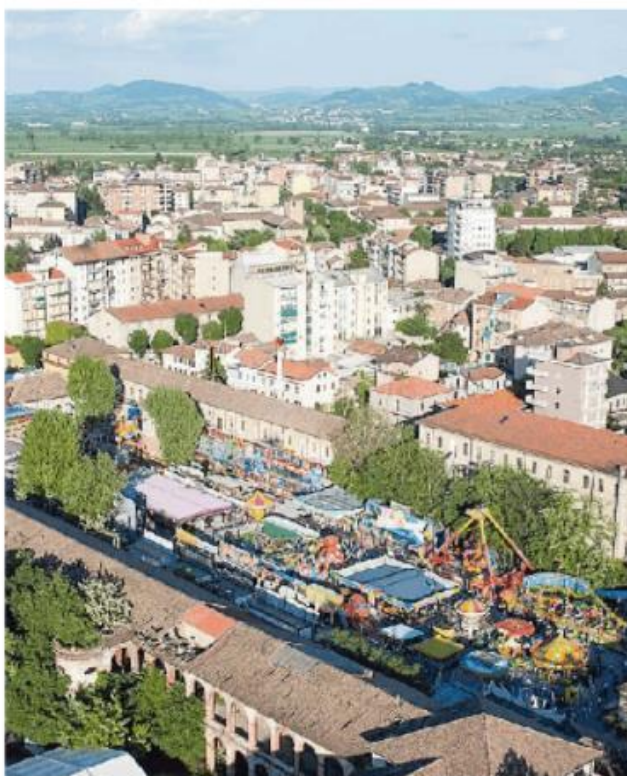
Una veduta dall'alto di Voghera: si discute del futuro pgt

L'amministrazione comunale proprio in questa direzione promuove un percorso partecipativo per la variante generale al piano di governo del territorio vigente, con una serie di incontri che han-