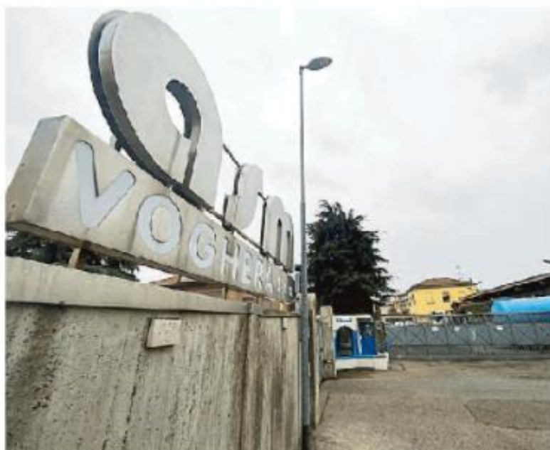
La sede di Asm SpA, critiche dei sindacati sul fronte assunzioni

somma gli interventi di pulizia delle strade in caso di nevicata. Da quello che è stato possibile sapere, nessuna ditta ha presentato l'offerta ed è andato deserto. Motivo? Non era stata fatta la revisione prezzi rispetto allo scorso anno. «Poi non vengano a dare la colpa ai lavoratori, come accaduto in passato», mettono le mani avanti i sindacati.