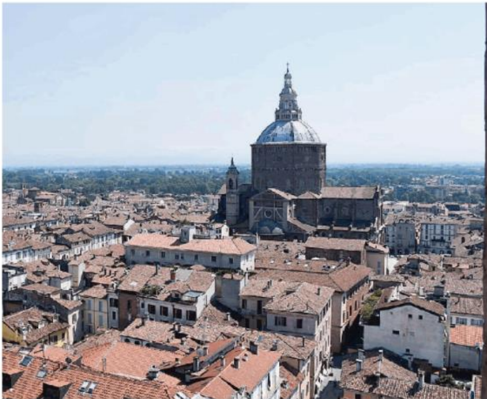
Pavia si scopre più green nella classifica di Legambiente, ma sono ancora poche le piste ciclabili