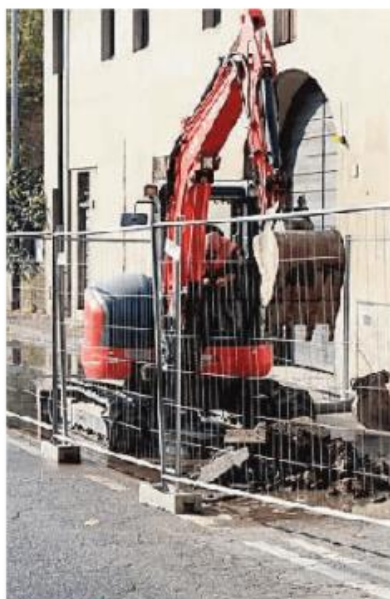
LA RUSPA AL LAVORO PER CERCARE DI RIPARARE LA ROTTURA DEL COLLETTORE

«L'obiettivo immediato è stato quello di bloccare la fuoriuscita di reflui, in modo da eli-