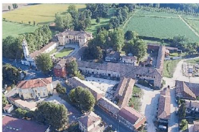
Una veduta aerea di Torre d'Isola sempre più paese «green»

«Il nostro progetto porterà a una completa riqualificazione e valorizzazione del centro, spostando l'attenzione dalle auto ai pedoni, nell'ottica di una maggiore vivibilità e frui-