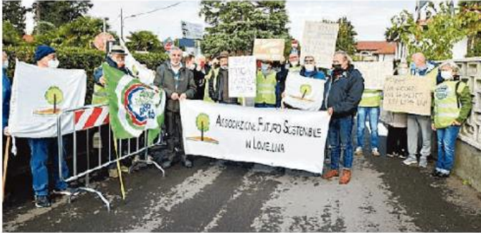
La protesta degli ambientalisti contro i fanghi in agricoltura