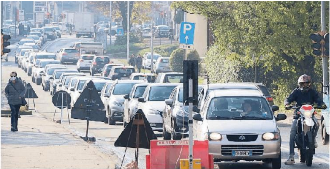
Le lunghe code ieri nella zona a causa dei lavori sulla fognatura ceduta fra Toretta e via Tasso

per il momento dovrebbe essere sufficiente per evitare problemi almeno nell'immediato. Pavia Acque infatti ha già pronta la progettazione e a breve farà partire la gara.