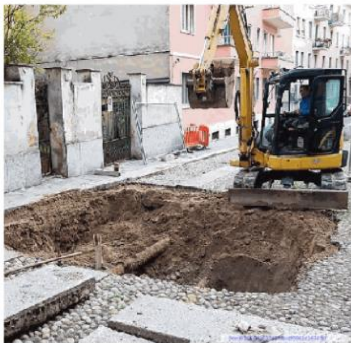
Una mini ruspa al lavoro per cercare le cause del guasto

Ieri mattina in via Rezia, a pochi passi dal Duomo, il manto stradale è crollato in due punti ben distinti. Con tutta probabilità si tratta di un problema legato alla rete fognaria. Gli operai di Asm sono intervenuti insieme alla Polizia Locale per cantierizzare le due piccole aree e modificare la viabilità della zona: il tratto in direzione via Cardano è stato chiuso, mentre sarà possibile passare per via Maffi. Ora si tratta di procedere agli scavi e circoscrivere il problema. Bisogna andare con ordine a riguardo, dato che trattandosi di una zona in centro storico non è esclusa la possibilità di rinvenire reperti archeologici; una situazione per la quale anche la Sovrintendenza alle Belle Arti dovrà effettuare un sopralluogo. Altro fattore da tenere in considerazione è il tipo di condotta fognaria. Posto che la criticità è relativa agli scarichi dei liquami, con la rimozione delle lastre in granito presenti sul manto stradale bisognerà stabilire se l'ammaloramento riguarda una tubatura afferente ad un condominio, oppure un cunicolo più profondo e antico ipoteticamente di età romana. Inoltre, bisogna tenere conto degli altri sottoservizi,