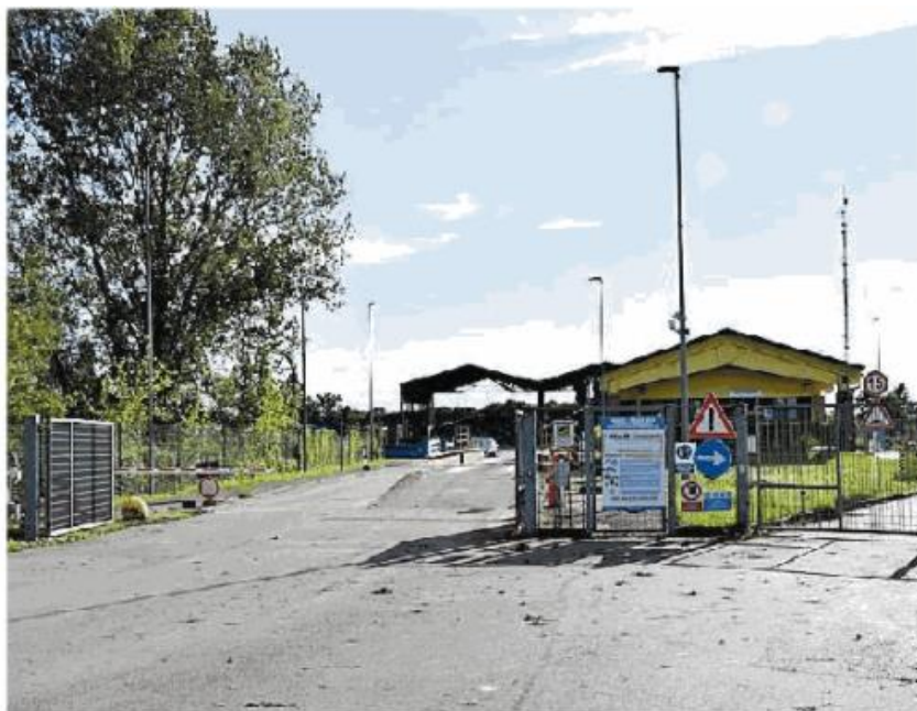
L'area di Montebellino si trasformerà in un punto di riciclo dei rifiuti

Il verde è una voce importante nell'economia di Asm: all'azienda arrivano, ogni anno, 15 mila tonnellate di ramaglie e foglie derivanti dalla differenziata (i cassoni verdi) e 2 mila dalla manutenzione delle aree pubbliche. L'idea è quella di introdurre il porta a porta anche per il verde, in modo che la frazione vegetale non sia frammista a rifiuti di altro tipo. Il materiale così raccolto verrà tritato da un impianto e potrà essere usato per alimentare impianti di cogenerazione anche di terzi, per produrre compost per l'agricoltura o per realizzare lettiere per animali. Una parte del legno farà funziona-