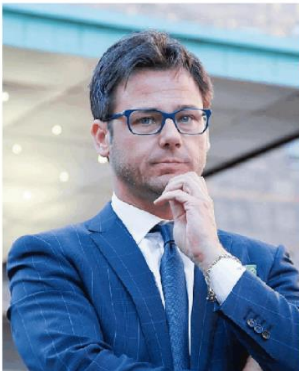
Angelo Ciocca, europarlamentare, riapre la discussione nella Lega

Ciocca spiega: «Quando si parla di scelta di un candidato presidente destinato ad amministrare un ente importante come quello provinciale non esistono "partite contro una persona o l'altra", ma esiste la necessità di avere un territorio unito. In provincia di Pavia abbiamo 20 sindaci della Lega; è importante che il candidato sia condiviso dal-