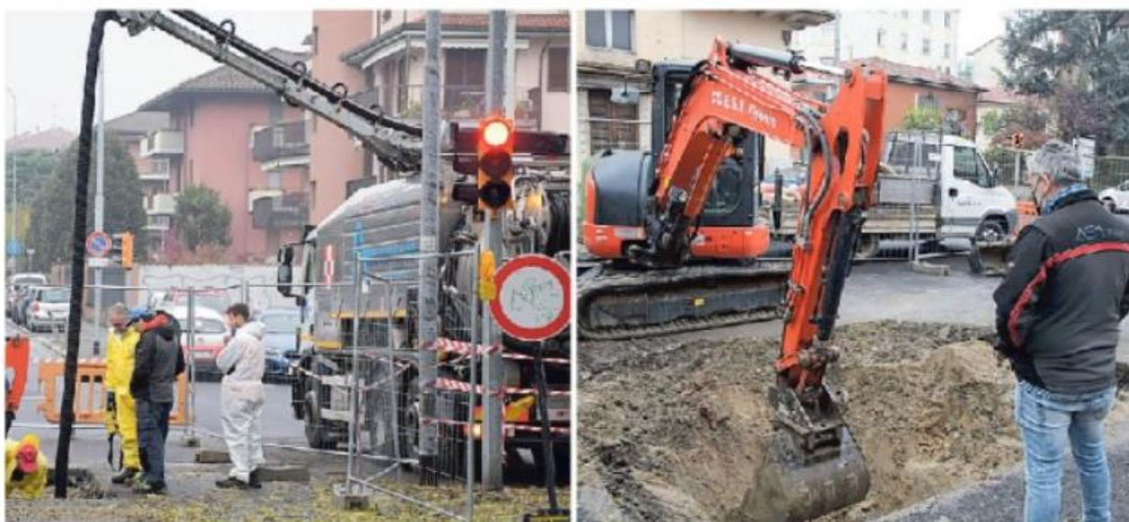
A sinistra una delle idrovore che raccoglie liquami per evitare che finiscano in falda. A destra scavi alla ricerca dell'origine del guasto