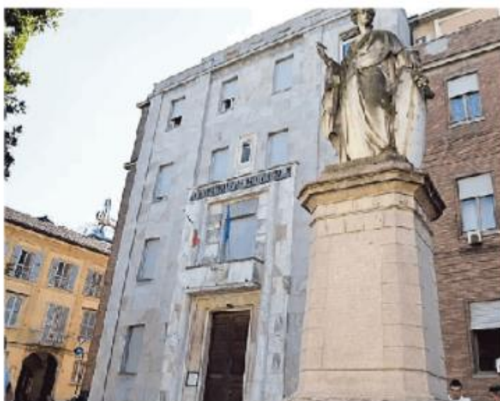
Il 18 dicembre si voterà per il presidente e il Consiglio provinciale