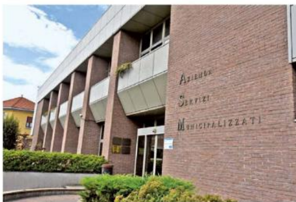
La sede di Asm Vigevano Lomellina in viale Petrarca