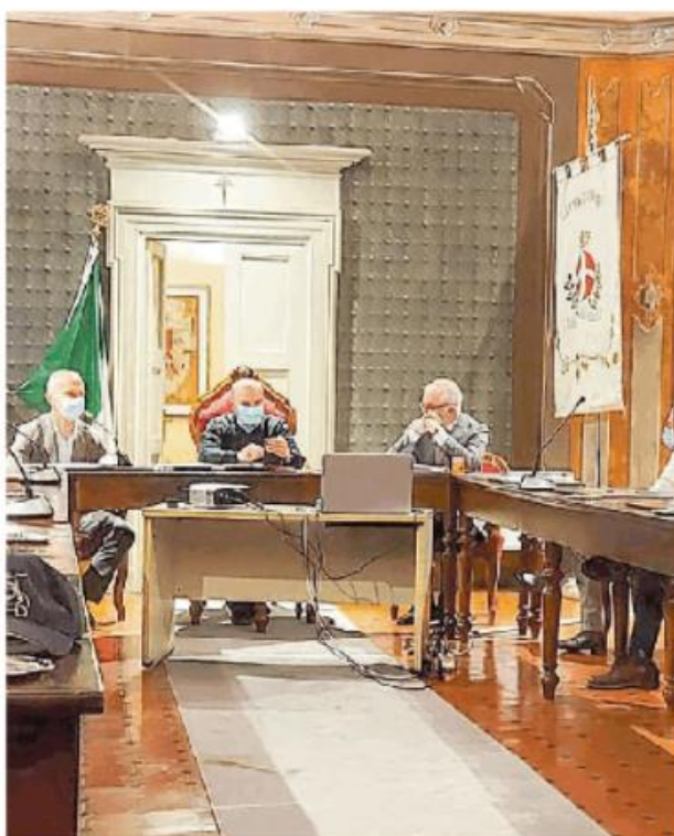
Il consiglio comunale a Broni nel quale sono stati presentati i conti

La relazione di Bina è partita dai costi dei servizi nel 2020: acquedotto, fognature e depurazione hanno portato un utile di 1 milione di euro, il settore rifiuti ha perso 200.000 euro, a causa della pandemia la Rsa di Stradella 600.000 euro e la piscina di Broni 170.000. Sui conti pesano poi 1,7 milio-