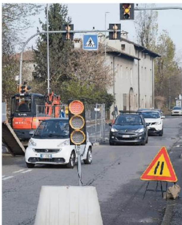
Lavori per riparare il nuovo cedimento in via Torretta

Tubazioni con circa quarant'anni di vita che necessitano di essere sostituite. L'intervento, seppur rapido, di Asm Pavia, non ha potuto scongiurare un nuovo danno ambientale nel prezioso corso d'acqua che si snoda lungo un parco di 35 ettari. Da qui la necessità di un intervento risolutivo per evitare ulteriori collassi. Intervento di cui si dovrebbe occupare Pavia Acque che