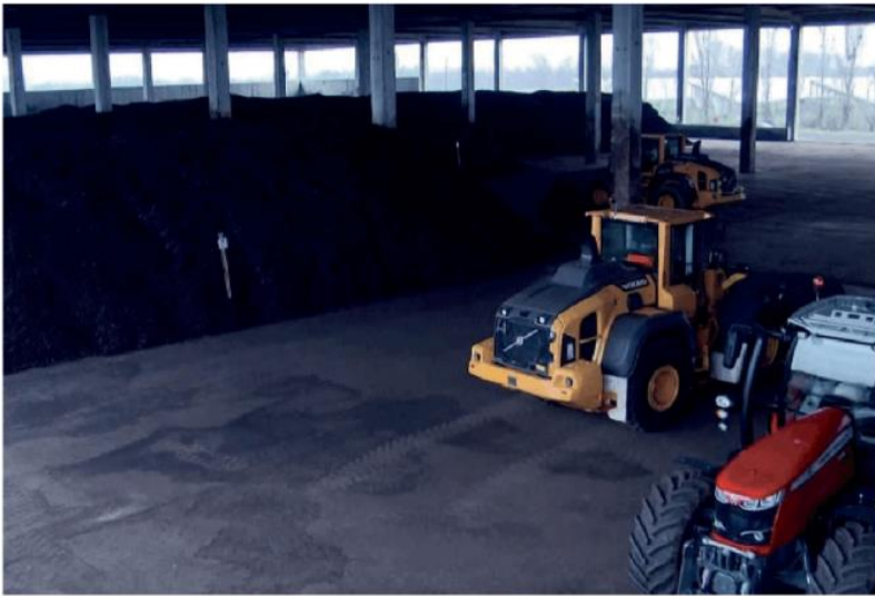
L'interno della "Var" di Belgioioso al centro dell'inchiesta. In alto a destra il sindaco di Barbianello, agli arresti

Ai domiciliari il primo cittadino di Barbianello e il titolare della ditta Var. Tra gli altri 6 indagati una dipendente Coldiretti