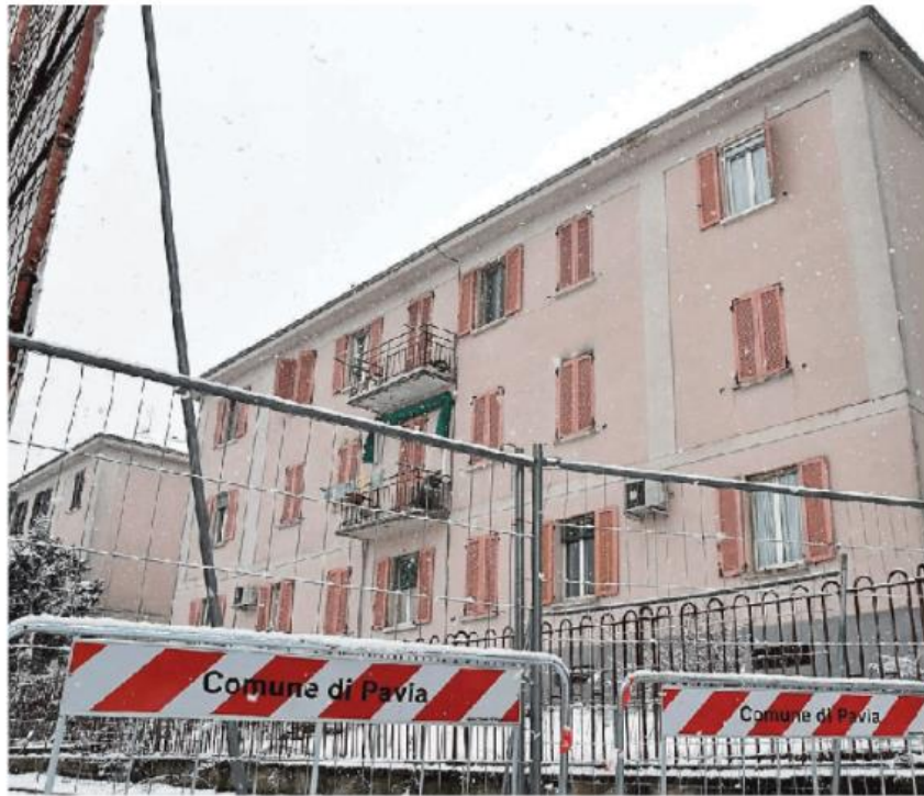
La palazzina al 4/C di via De Motis dopo dieci mesi dall'allarme e dal cedimento è ancora off limits