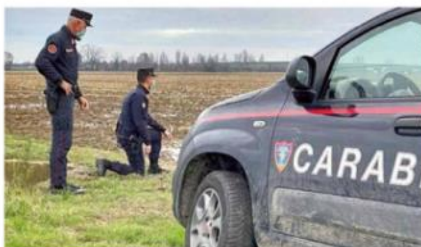
L'operazione è stata effettuata dai carabinieri forestali di Pavia

PAVIA - Il Codacons, il coordinamento delle associazioni per la tutela dell'ambiente e dei diritti dei consumatori, è pronto a costituirsi parte civile nel processo che seguirà l'operazione effettuata la scorsa settimana dai carabinieri forestali di Pavia. Le loro indagini hanno consentito di accertare che i fanghi che venivano sparsi sui campi come fertilizzanti erano in realtà prodotto di rifiuti. A seguito delle risultanze investigative il giudice per le indagini preliminari del Tribunale di Pavia, Luigi Riganti, ha emesso tre misure cautelari con le ipotesi di reato di inquinamento ambientale. Dalle analisi effettuate sui terreni da parte dei tecnici di Arpa, l'agenzia regionale per la protezione dell'ambiente, è risultata una concentrazione di arsenico superiore ai limiti. Il giudice ha inoltre disposto il sequestro di un impianto di trat-