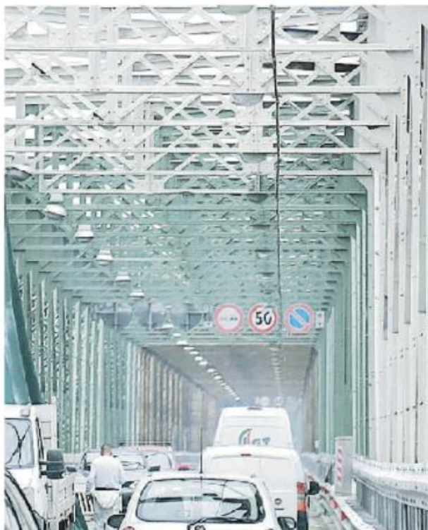
All'incontro si parlerà della situazione attuale e del progetto futuro