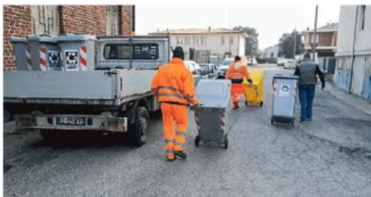
Sulla raccolta rifiuti potrebbe scattare la protesta dei lavoratori