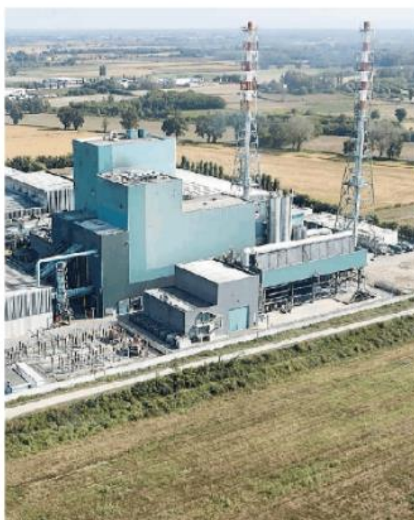
L'inceneritore di Parona: qui prsto anche un impianto fanghi