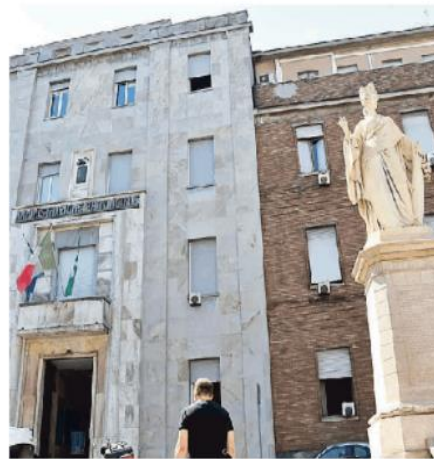
La sede dell'amministrazione provinciale in piazza Italia a Pavia