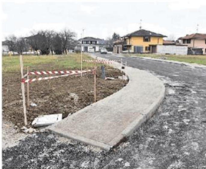
La zona di via Maestro Pietro Rossi

Le case le hanno costruite in via Maestro Pietro Rossi e in via Don Lorenzo Milani, a Voghera nel 2016. Il resto no: a volte mancano le fognature, i parcheggi, persino alcune strade di accesso, l'illuminazione. E chi aveva acquistato gli appartamenti – che fossero in case bi-familiari o in piccoli condomini – lo aveva fatto anche sulla scorta, come dire, di quello che c'era intorno. O ci sarebbe stato. E invece... Invece, per ragioni che qui non interessano, i costruttori non avevano completato le opere: o meglio, avevano sì realizzato le abitazioni ma non le necessarie, e obbligatorie, urbanizzazioni. Dopo diversi anni, almeno un paio, e diversi contatti con l'amministrazione comunale (perché le opere di urbanizzazione sono fatte "per conto" del Comune), la giunta Barbieri, su parere degli uffici, ha deciso di incassare (tecnicamente: escutere) le fidejussioni delle società, ossia, per capirci, le garanzie finanziarie presso le banche. E con quei soldi, poco meno di 350mila euro, realizzare le sopra citate opere di urbanizzazione. La giunta Garlaschelli, proprio in queste ultime settimane, ha provveduto ad approvare i progetti esecutivi che permetteran-