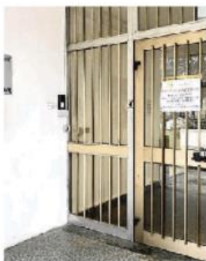
La sede della Broni-Stradella

pronti ad azioni di protesta, come presidi sotto i municipi di Stradella e Broni, un'assemblea pubblica con i cittadini e, probabilmente, anche uno sciopero.