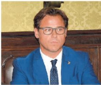
Angelo Ciocca, 46 anni, deputato europeo