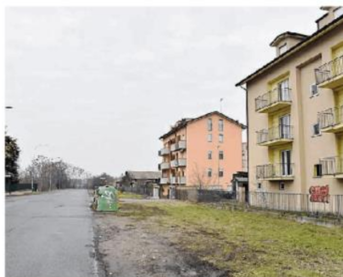
L'area edificata in via Don Lorenzo Milani