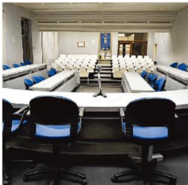
La sala nel palazzo di piazza Italia che ospita i consigli provinciali

Infine gli indirizzi per la nomina, designazione e revoca dei rappresentanti della Provincia presso enti, aziende e istituzioni e organismi partecipati. A dire il vero, la Provincia mantiene poche partecipazioni rispetto al passato, ad esempio nell'Atto, l'Ambito territoriale ottimale e nei due Gal, i gruppi di azione locale, dell'Oltrepò e della Lomellina. Inoltre la fondazione Adolescere di Voghera è presieduta di diritto dal presidente dell'ammi-