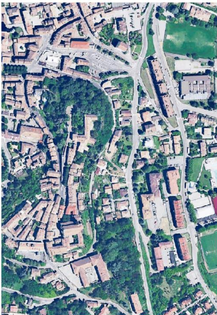
Una veduta della città di Casteggio dall'alto

del Piano di Governo. Purtroppo è arrivato il Covid a rallentare tutto, ma alla fine siamo giunti alla fase di adozione, in attesa della approvazione definitiva. Da una parte puntiamo sulla tutela del paesaggio e della biodiversità, preservando tutta la zona urbana dalla via Emilia verso le colline; dall'altra cerchiamo di favorire lo sviluppo dell'area